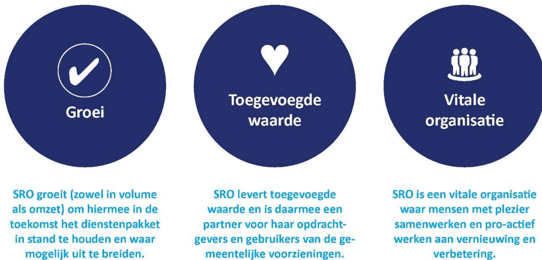
Figuur 1 De drie ambities van SRO