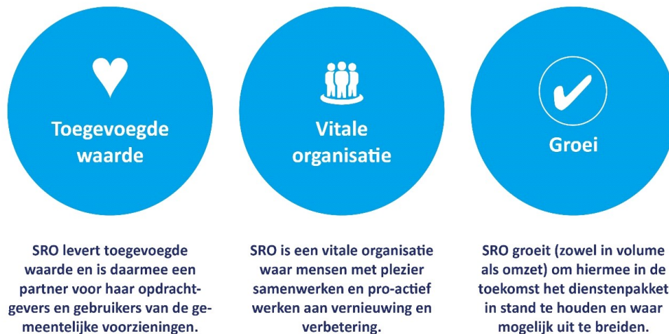
Figuur 1 De drie ambities van SRO